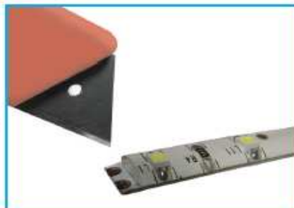
voděodolné pásky je nutno nejdříve odizolovat