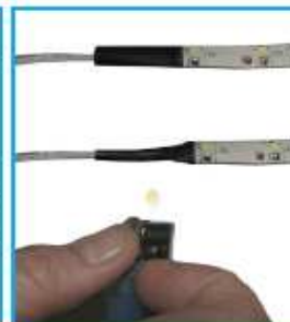
smršťovací bužírka chrání spoj LED pásky

Zapojení doporučujeme svěřit odborné firmě. Na vady vzniklé nesprávným zapojením se nevztahuje reklamacie.